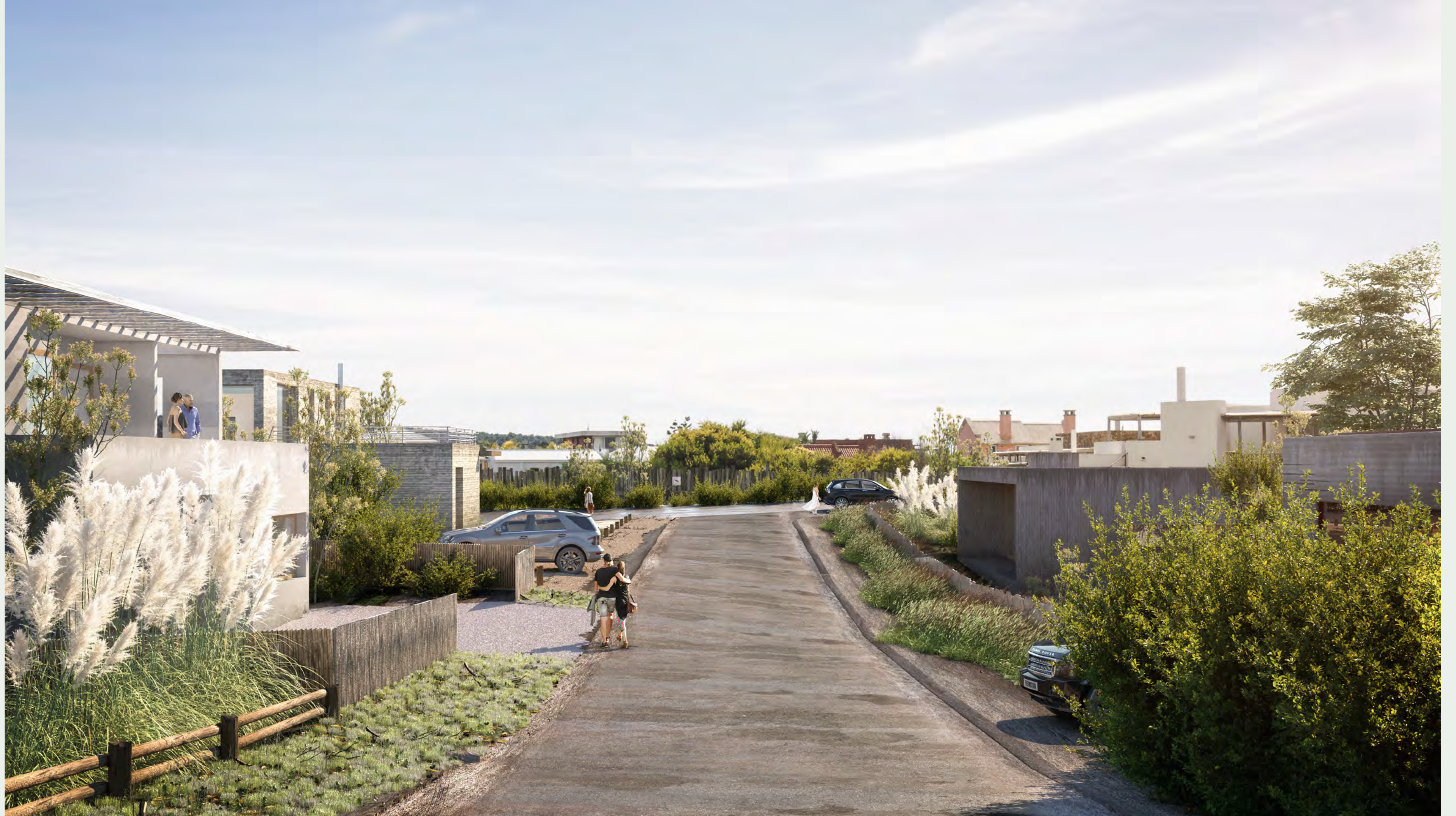
— Calle interna / Inner street