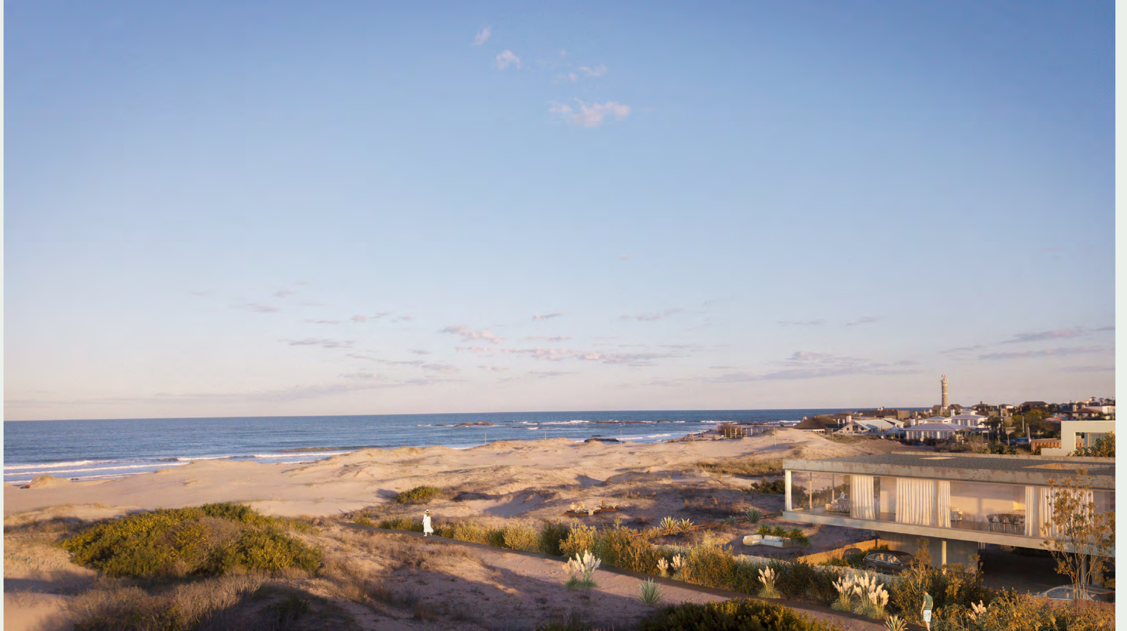
— Casa sobre línea de playa / House on the beach line